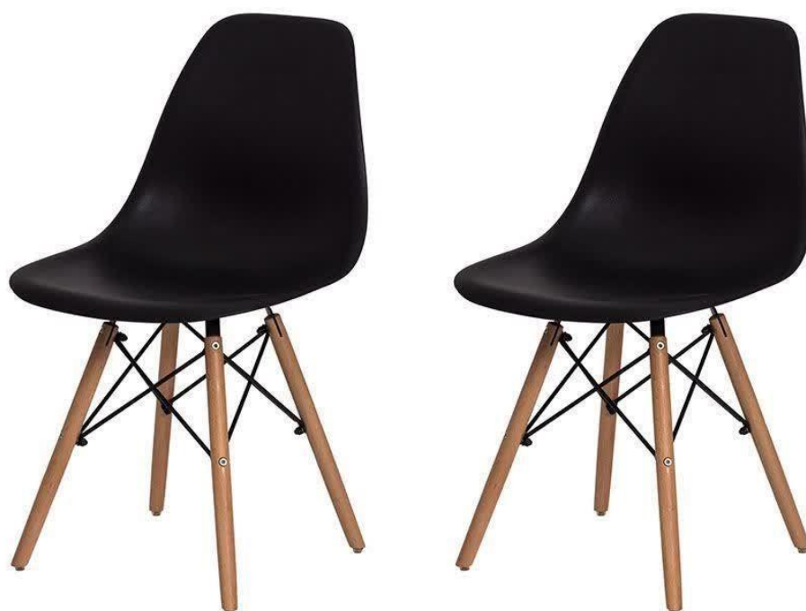
Figura 3 - Exemplo de cadeiras em polipropileno com pés de madeira, item nº 102